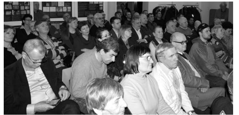
Į diskusiją apie Šventosios upės užtvankos ateitį susirinko pilna bibliotekos salė.

Aplinkos ministerija laikosi požiūrio, kad ūkiškai nenaudojamos užtvankos neužtikrina upės vientisumo, efektyvios žuvų ir kitų vandens organizmų migracijos, kelia pavojų aplinkai ir žmonių saugumui, todėl, pasinaudojant ES investicijomis, turėtų būti rekonstruojamos. Europoje per pastaruosius tris dešimtmečius išmontuota jau keli tūkstančiai užtvankų. Lietuvoje kol kas – nė viena. Anykščiai būtų pirmasis išlaisvinęs upę Lietuvos miestas.