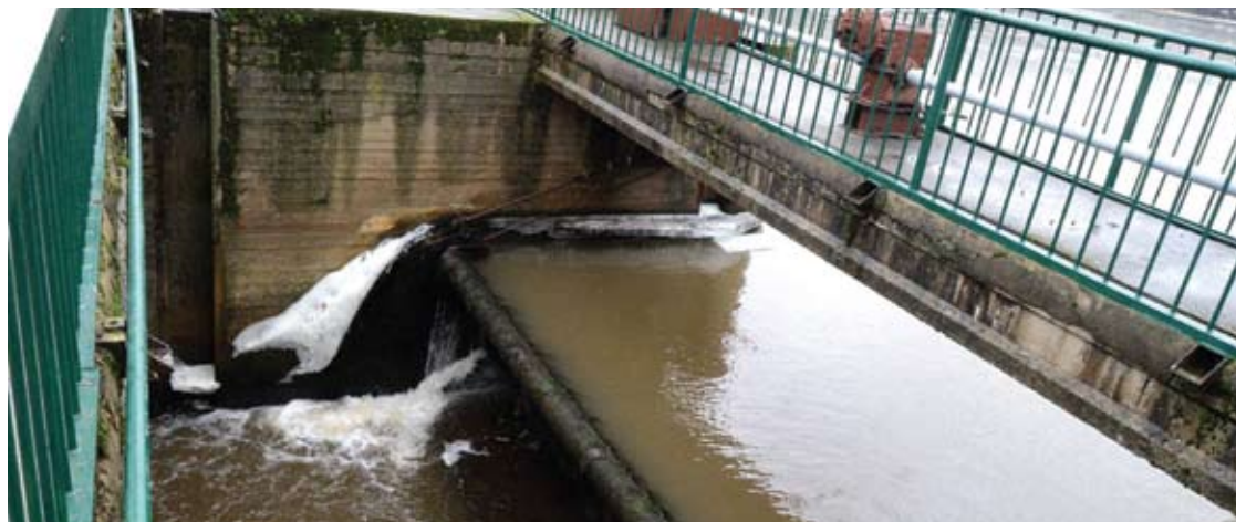
Europoje per pastaruosius tris dešimtmečius išmontuota keli tūkstančiai užtvankų, bet Lietuvoje – nė vienos. Ar Anykščiai bus pirmieji?