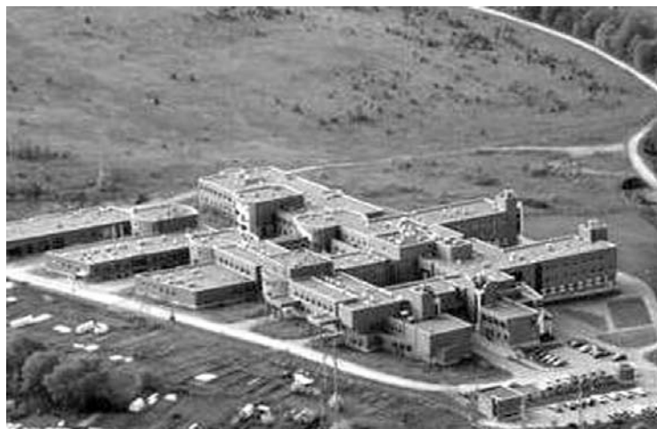
Trūkstančių specialybių gydytojais galės gauti kasmetines išmokas.