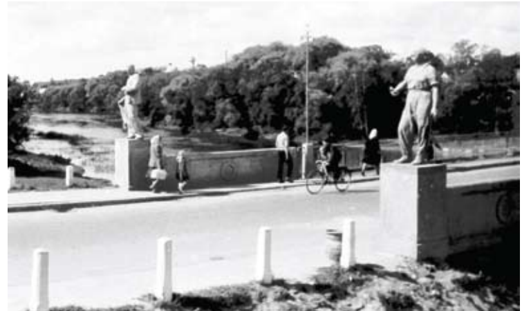
Fotografo Izidoriaus Girčio užfiksuotas tiltas, puoštas statulomis, per Šventąją Anykščiuose.

„Aš nesu už tai, kad jo negatyvai būtų saugomi bibliotekoje, kuri neturi tam reikalingų sąlygų. Jei būtų mano valia, aš negatyvus perduočiau Lietuvos centriniam valstybės archyviui, kur jais tikrai būtų gerai pasirūpinta. Jie būtų visi nuskenuoti, sukataloguoti ir prieinami visiems", - pastebėjo T.Ivanauskas.